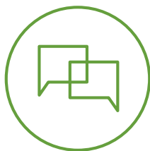
Aukera berdea gunea