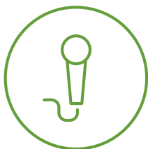
Hitz berdea gunea