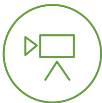
Film berdea gunea