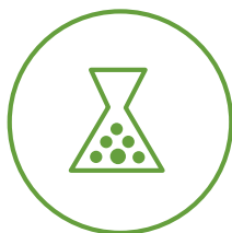
Zirkulo berdea gunea